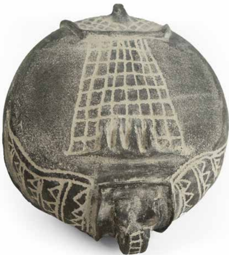
De la serie Patio