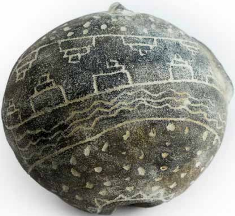
De la serie Patio