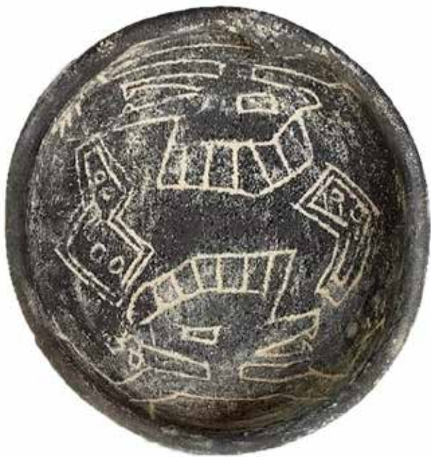
Aprendimos del mismo lugar, 2023