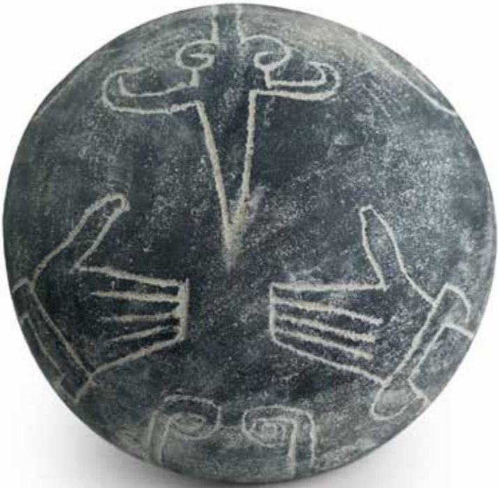
Diálogos y conversaciones