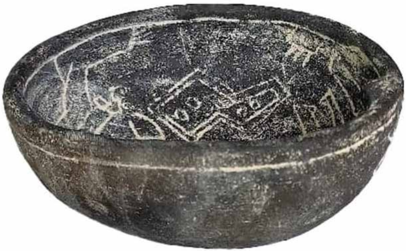
Aprendimos del mismo lugar, 2023