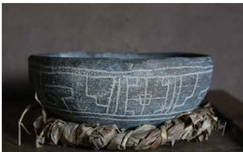
Diálogos y conversaciones