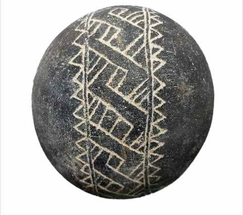
Aprendimos del mismo lugar, 2023