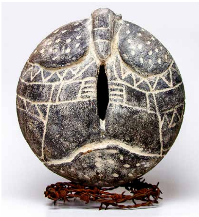
De la serie Patio