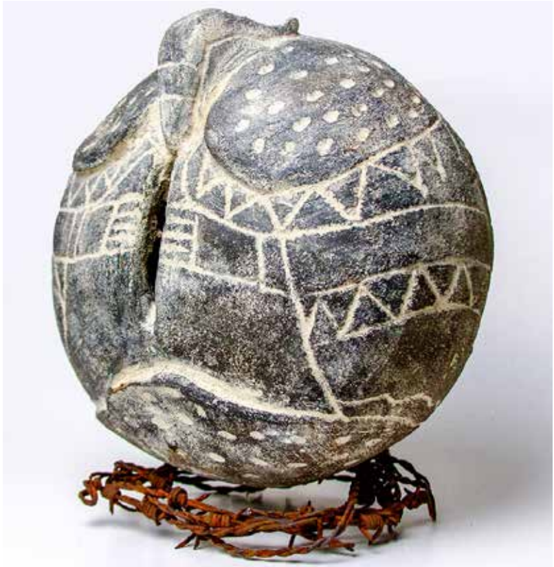
De la serie Patio