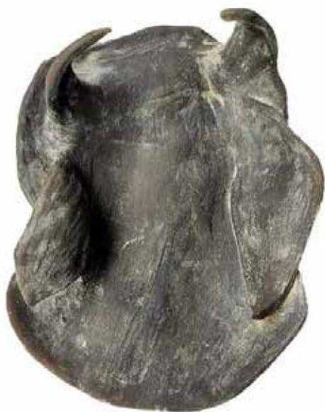
Cabeza de Toro, 2021